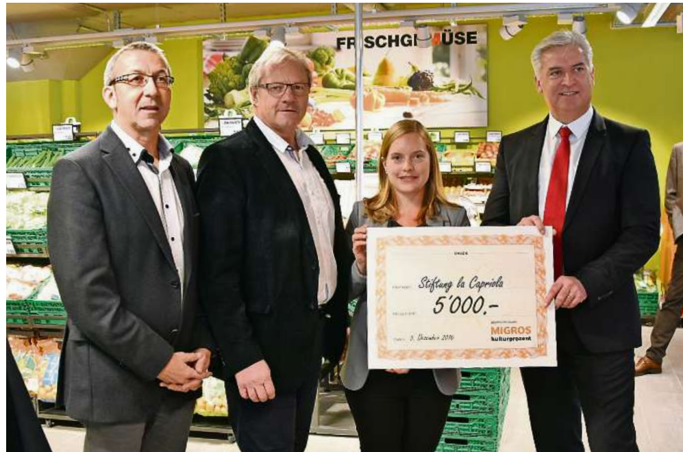
Die Stiftung «La Capriola» will mit dem Geld der Migros eine Projektwoche zum Thema «Bergwald» durchführen.

Losgegangen sei der Umbau im August 2015, nachdem die Migros aus ihren Räumen ausgezogen war. «Für die verbleibenden Mieter war die nachfolgende Zeit zuweilen sehr strapaziös. Es gab Bauärm, eine Asbestsanierung musste durchgeführt werden und die Heizung fiel aus. Die Mieter litten wirklich und es gebührt ihnen grosser Dank dafür, dass uns trotzdem nie eine Reklamation erreicht hat», betonte Fopp. Ein weiteres Lob wolle er der Nachbarschaft aussprechen, welche sich ebenfalls sehr geduldig gezeigt habe. «Nachdem es im März mit dem Umbau so richtig losging, waren sie